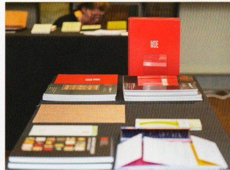
Hochwertige Publikationen: internationale Vereinigung „Meister der Einbandkunst“.