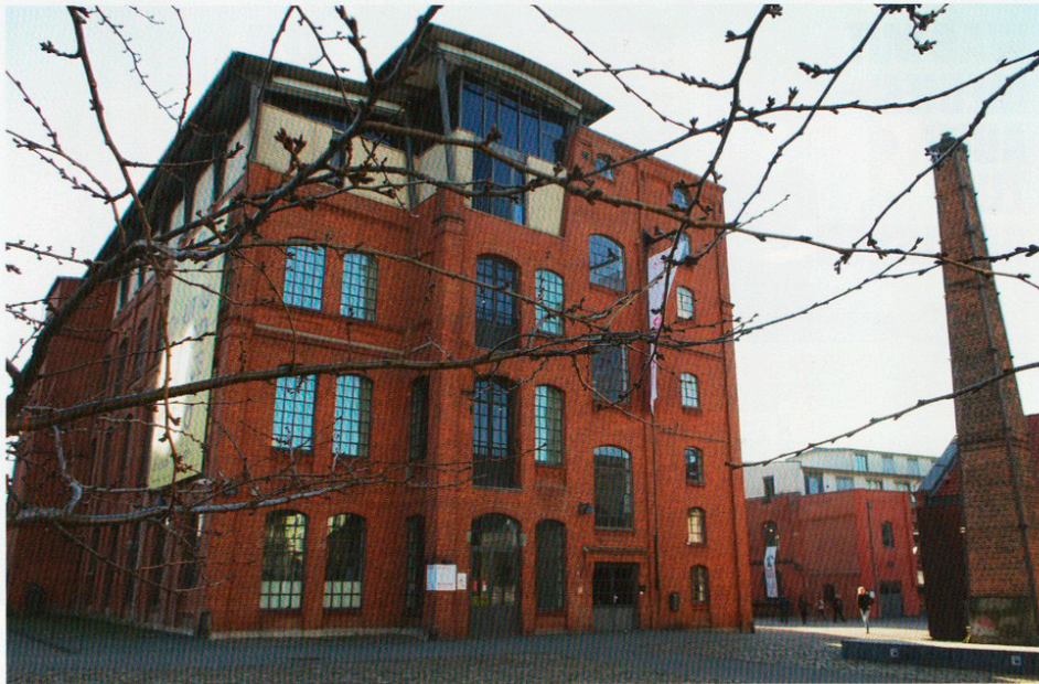
Bekanntes Location: Museum der Arbeit in Hamburg-Barmbek.