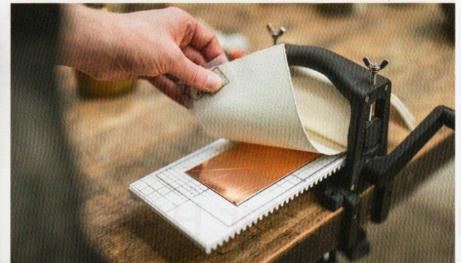
Funktionale 3D-Druckpresse: Initiative zweier Kölner Designer.